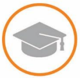
Вузы, колледжи, центры занятости