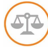
Поставщики, подрядчики, клиенты